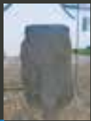
GORMS STEN King Gorm's Rune Stone