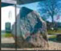
HARALD BLÅTANDS STEN King Harald Bluetooth's Rune Stone