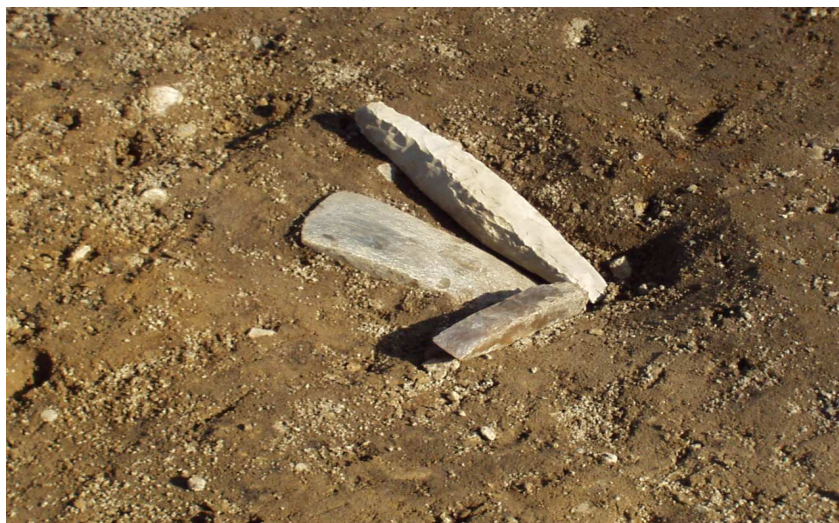
Økse og to mejsler fra VMÅ 2446.

Ved Tandrupgård 9 (VMÅ 2446) blev udgravet en nedgravning indeholdende en flot flintøkse og to flintmejsler, se vedlagte billede. Fundstedet lå nær et gammelt vådområde, og det kan tænkes, at flintgenstandene er nedgravet, enten som en skat eller som et offer.