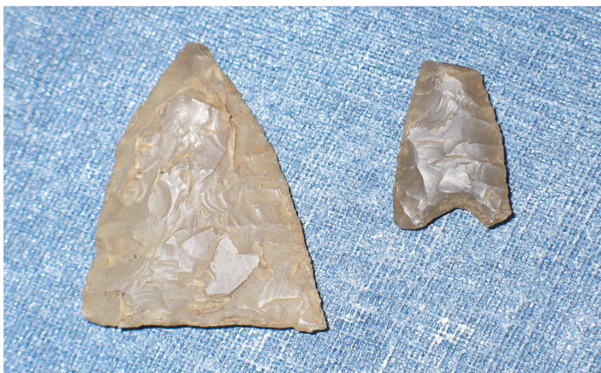
Fladehuggede pilespidser fra VMÅ 2412. Den venstre er 2,7 cm lang og 1,8 cm bred. Den højre er 1,5 cm lang og 0,8 cm bred. Spidsen er knækket af den højre.

De øvrige anlæg i feltet så ikke ud til, at indgå i nogen konstruktion. I feltets sydlige del har der muligvis været rester af et kulturlag, hvori der blev fundet keramik dekoreret med furer og vinkelbånd. Keramikken ser ud til at være magret med bl.a. chamotte (knuste lerkarskår), som også styrker den givne datering. Der blev udtaget floteringsprøver fra stolperne og prøverne blev sendt til Moesgårds konserverings- og naturvidenskabelig afdeling. Prøverne indeholdt bl.a. forkullet byg og frø.