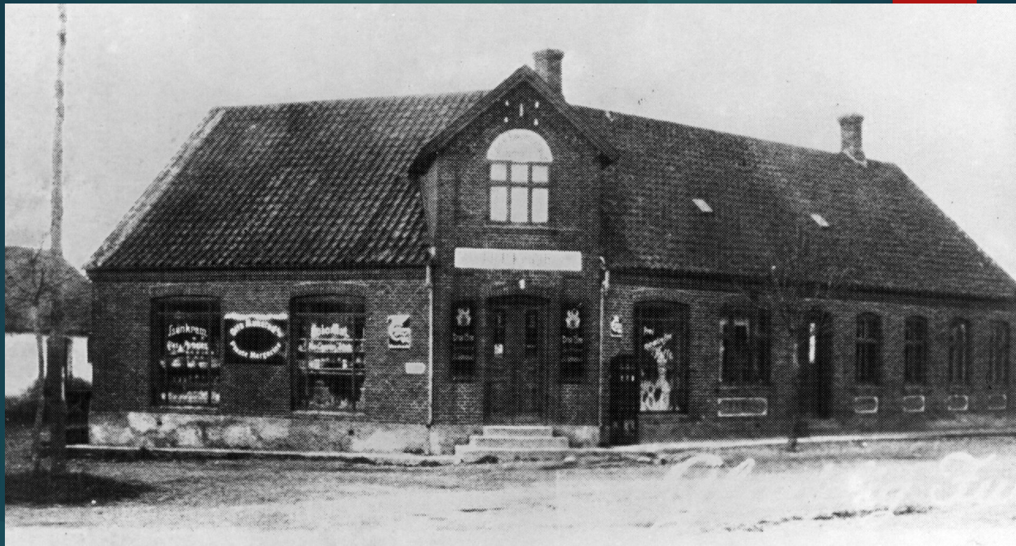
ALGADE 4 – ÅRG. 1905 MATRIKELNR. 2AK

Den første købmand på hjørnet af Algade og Storkegade. Ca. 1909.